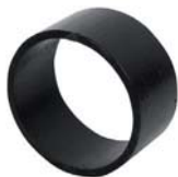
SLR 100 Ø114/101-55mm PRIMED

管套，优质低碳钢不带法兰 ▶ Mantelrohre, Baustahl geprimert, ohne Flansch ▶ Collarines imprimados en acero dulce sin ala ▶ Douilles sans bride en acier doux peint