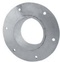
SLFR 100 Ø114/101-55mm galv

管套，镀锌低碳钢带法兰 ▶ Mantelrohre, feuerverzinkter Baustahl mit Flansch ▶ Collarines galvanizados en acero dulce con ala ▶ Douille avec bride en acier galvanisé