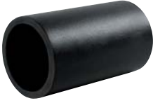
SLPPS 100 Ø114/101-156mm PRIMED

管套，优质低碳钢不带法兰 ▶ Mantelrohre, Baustahl geprimert, ohne Flansch ▶ Collarines imprimados en acero dulce sin ala ▶ Douilles sans bride en acier doux peint