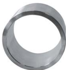
SLR 100 Ø114/101-55mm AISI 316

管套，耐酸不锈钢不带法兰 } Mantelrohre, säurefester, rostfreier Edelstahl ohne Flansch } Collarines sin ala en acero inoxidable anticorrosivo } Douilles en acier inox sans bride