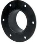
SLFR 100 Ø114/101-55mm primed

Collarines imprimados en acero dulce con ala ▶ Douilles avec bride en acier doux peint